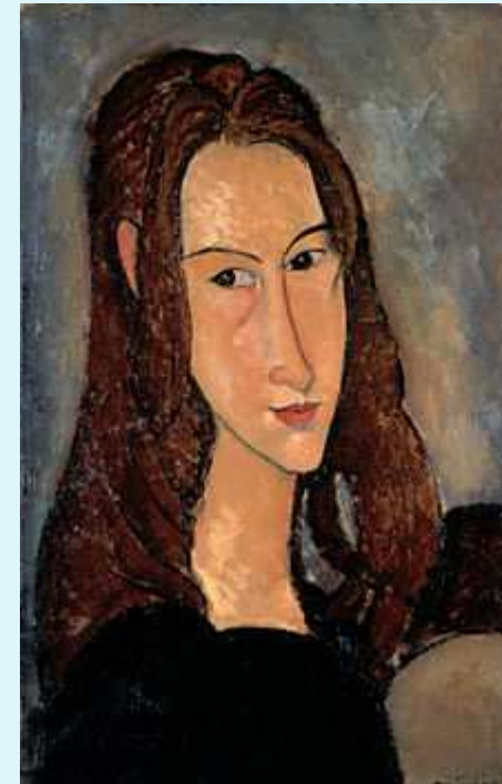
Jeanne Hébuterne (Amadeo Modigliani, 1918)