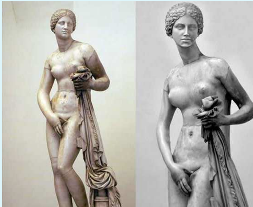
Vénus de Cnide (Praxitèle)