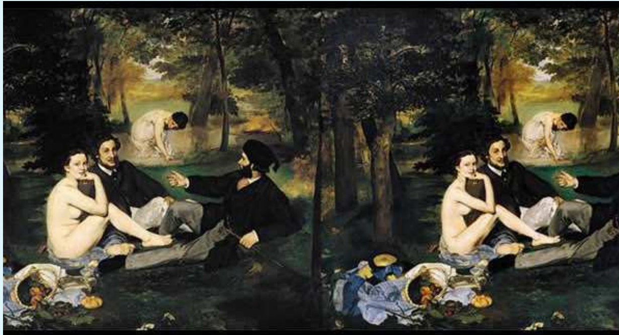
Le déjeuner sur l'herbe (Edouard Manet)