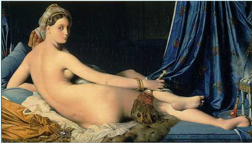
La grande odalisque (Jean-Auguste-Dominique Ingres, 1814)