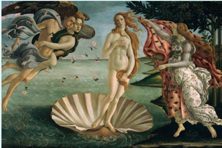
↑ La naissance de Vénus (Sandro Botticelli, 1486)