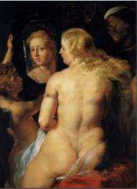
→ Vénus au miroir (Pierre Paul Rubens, 1615)